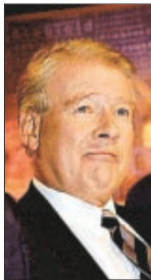
NÅR FREM. Carl I. Hagen.