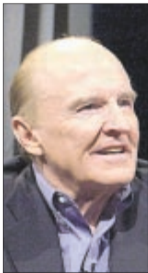
TYDELIG. Jack Welch.

Det er interessant å observere hvordan Carl I. Hagen og Kristin Halvorsen har styrket sin posisjon. Mye av deres appell ligger nok nettopp i deres evne til å kommunisere enkelt, tydelig og engasjert med velgerne. Dagens ledere har noe å lære av