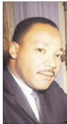
GOD TALER. Martin Luther King Jr.